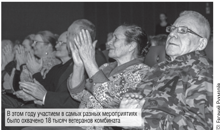
В этом году участием в самых разных мероприятиях было охвачено 18 тысяч ветеранов комбината